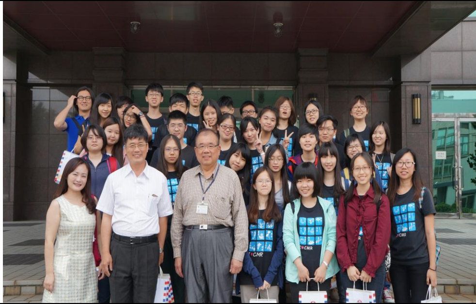
藥廠參訪—勝昌製藥股份有限公司