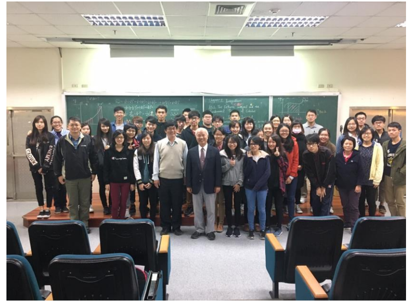
植物組織培養技術分享(朝陽科技大學化學系教授)