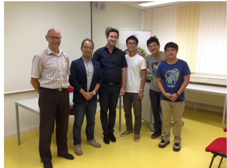
瑞士 Complemedis 公司(海外實習)