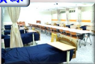
擬真智慧化臨床護理教學中心