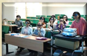
中部唯一3D互動解剖教學