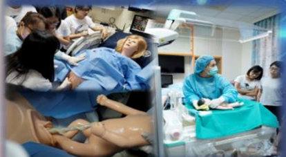
產科護理學及實作