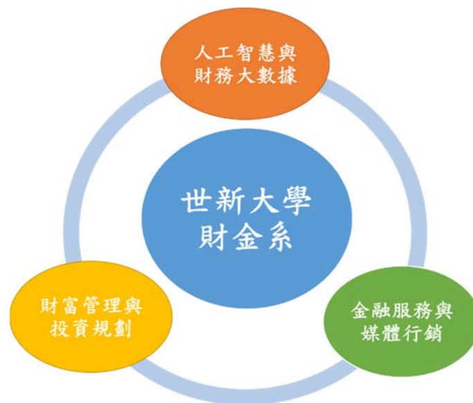
圖 1: 世新財金三大特色領域

因應時代金融趨勢與需求，本系特別規劃三個特色領域 (詳見圖 1)，以加強學生面對未來之適應性與競爭力。這三個領域是：財富管理與投資規劃、金融服務與媒體行銷、人工智慧與財務大數據。此外，本校位於台北市，臨近台灣大學與政治大學，學生可就近接觸其學習資源；生活環境上接近景美商圈、公館商圈與師大商圈；學校有新建的管理學院大樓及完整而專業先進的傳播學院，本系的學生可在管院環境中學習並可方便接近傳播專業之同學、學長姐與校友。學校有優良之圖書館及電算中心，在歐美日中等處有極多姊妹學校與交換學生計畫；並提供多樣獎助學金。