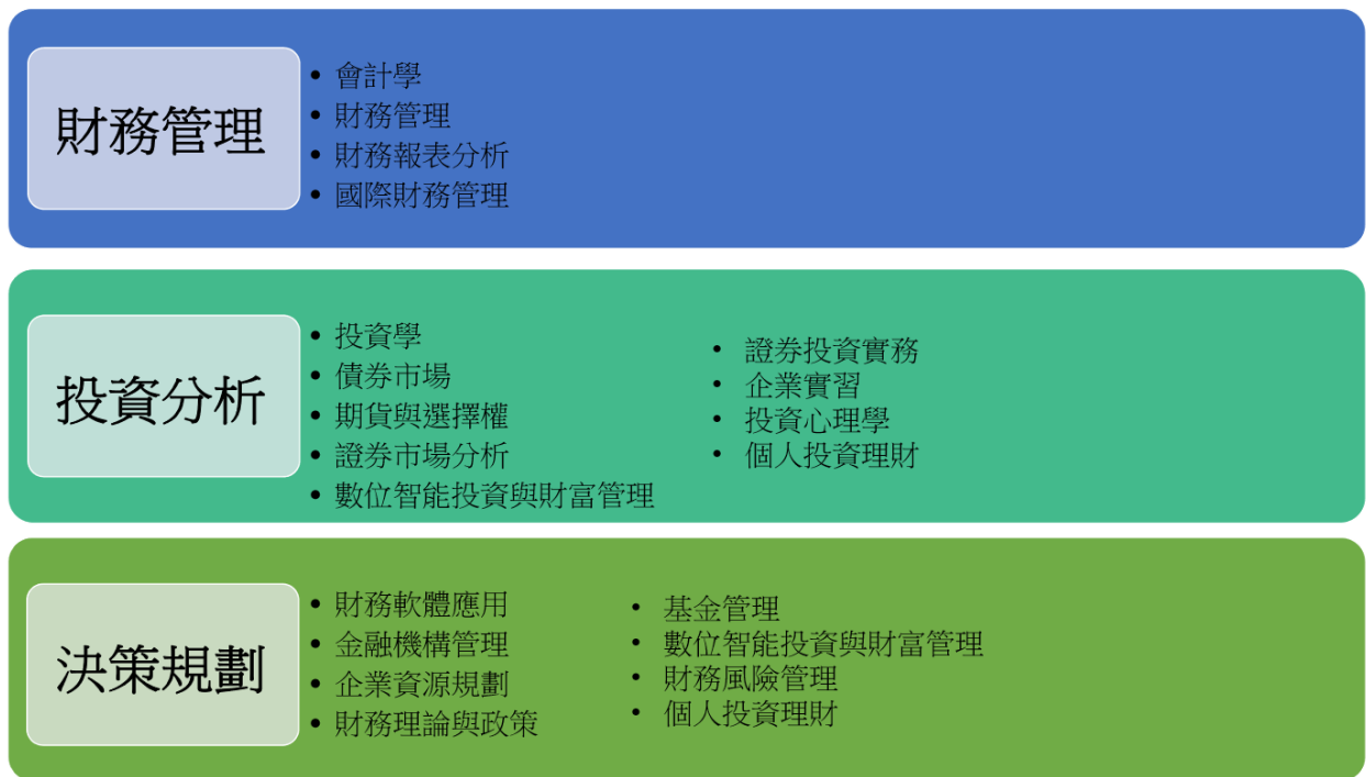
圖 2: 財富管理與投資規劃與對應之課程