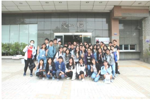
「血庫學」參訪台中捐血中心