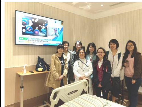
「幹細胞之臨床應用與研究」參觀細胞治療中心