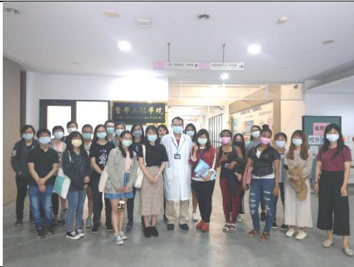
「精準醫學」課程參訪附設醫院精準醫學中心